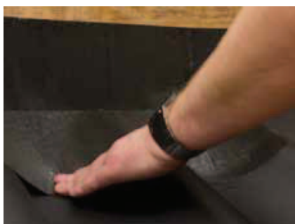
Aluflexen formes ned i bølgen. Der glattes og presses, så der kommer en 100 % vedhæftning.