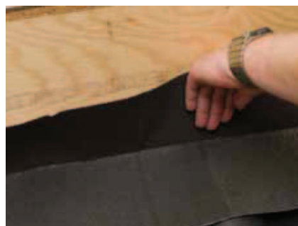
Aluflexen glattes og presses, så der kommer fuld vedhæftning.