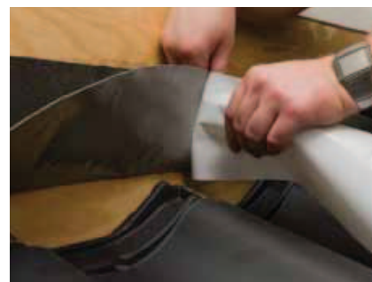
Papiret mod tagbeklædningen fjernes.