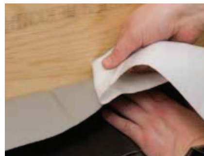
Ved den lodrette fastgørelse, fjernes papiret på bagsiden.