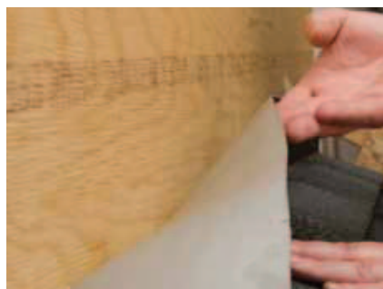
Klæben pressen op mod det lodrette fastgørelsessted.