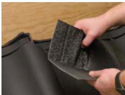
Aluflex bukkes efter samlingen på bagsiden.