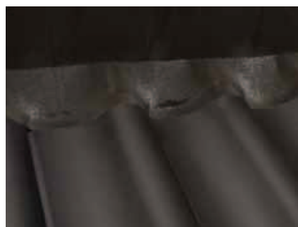
Det færdige resultat.