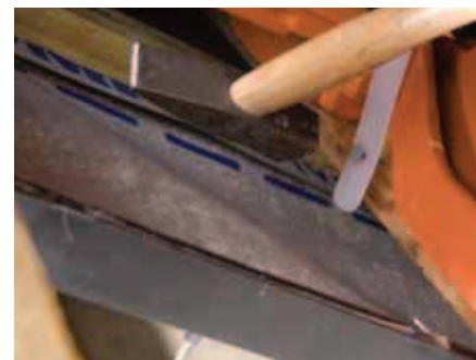
Plastikbinderen fastgøres på lægten med min. 1 stk. vejrbestandigt papsøm.