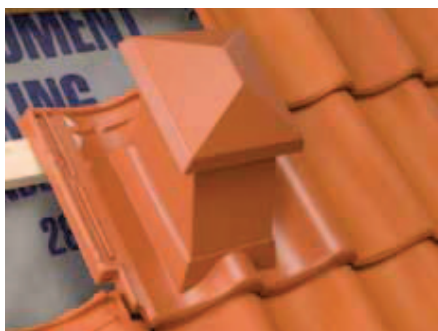
Hætten hænges på lægten efter fastgørelse.