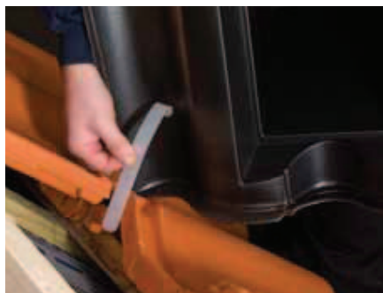
Plasthætten centrereres over gennemføringen. Plastikbinderen vippes ned på lægten.