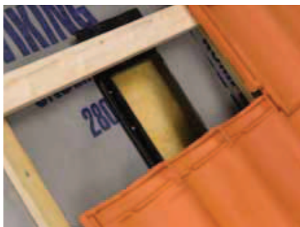
Klargøring til taghætte. Se evt. datablad for undertagsgennemføring.