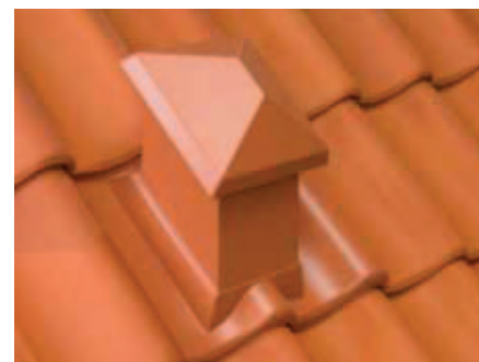
Tegl lægges omkring taghætten, så den fastholdes.