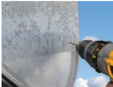
Hætten fastgøres med 2 stk. vejrbestandige popnitter eller skruer, på hver side af zinkhætten.