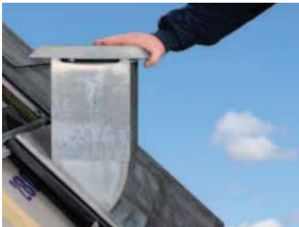
Zinkhætten sættes i lod.