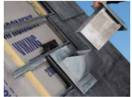
Zinkhætten sættes ned over bundstykket.