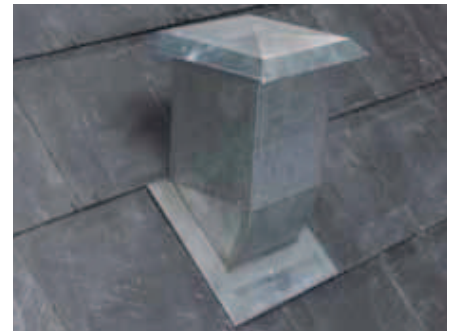
Skiferne lægges omkring hætten, så den bliver fastholdt.