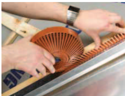
Fuglegitteret placeres på blindfalsen med gitterne ud mod skotrende.