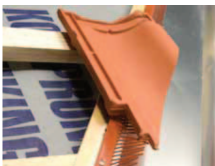
Det færdige resultat.

NB: Ved ekstrem vejrbelastning af tagfod, anbefales det at fuge mellem fuglegitter og undertag / fodblik, ved hver fastgørelse.