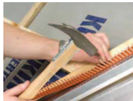
Fuglegitteret fastgøres med vejrbestandige papsøm pr. 25 cm.