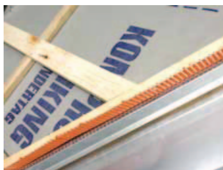
Fuglegitteret fastgøres helt til kip og tagfod.