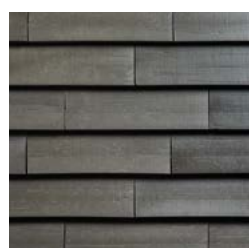
Arena 600U Stormy Grey