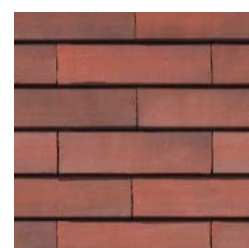
URBAN L Holmen